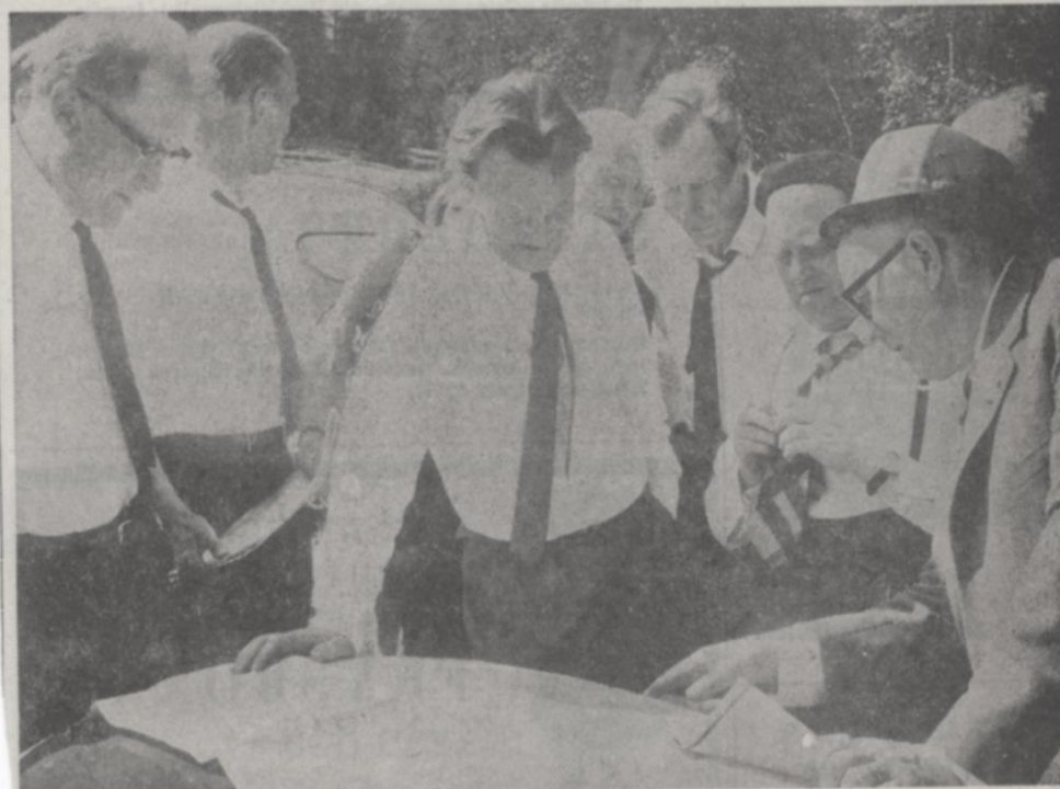
Samlade runt vägkartan på en motorhuv hölls "slutplädering" inför ägodelningsrätten i en vacker skogslänta i Toböle.